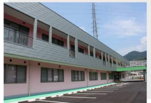
某福祉施設（広島県）カラーGL 鋼板 B 型