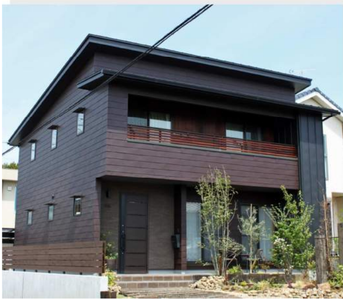
関市の家（岐阜県）カラーGL 鋼板 Cs 型