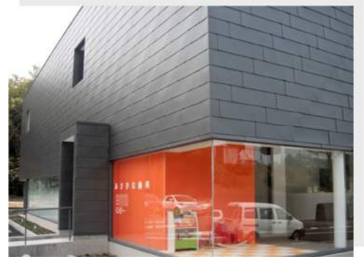
あさひな歯科医院（島根県）カラーGL 鋼板 B 型