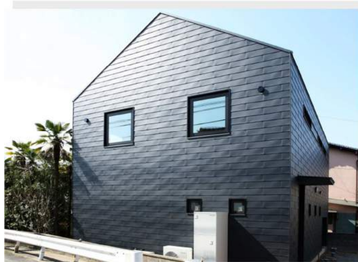
カーサ・ソーレ（福岡県）カラーGL 鋼板 Cs 型