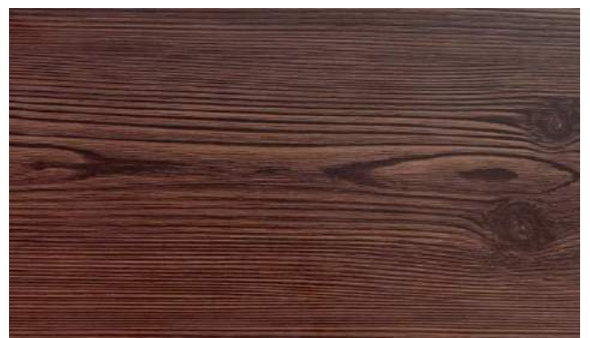
焼杉（ガルバリウム鋼板 板厚 0.35mm）標準材料

本社/〒578-0904 東大阪市吉原2丁目4番41号 TEL (072) 968-1200(代) FAX (072) 968-1212 東京営業所/〒331-0804 埼玉県さいたま市北区土呂町2丁目44-9 TEL (048) 662-1234 FAX (048) 662-1212