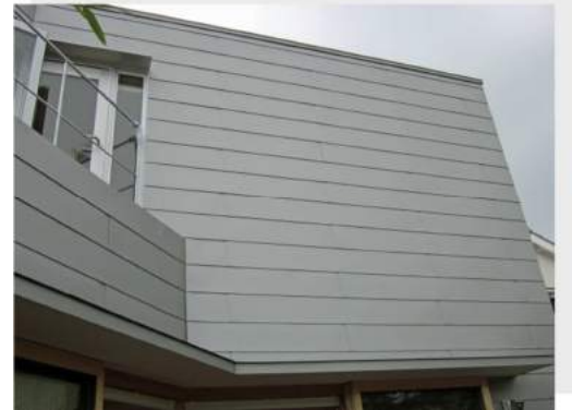
高倉台の家（兵庫県）カラーGL 鋼板特注品